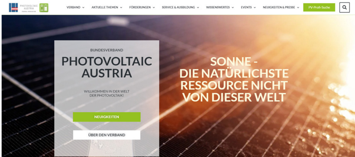
Webseite mit Bannerplatz