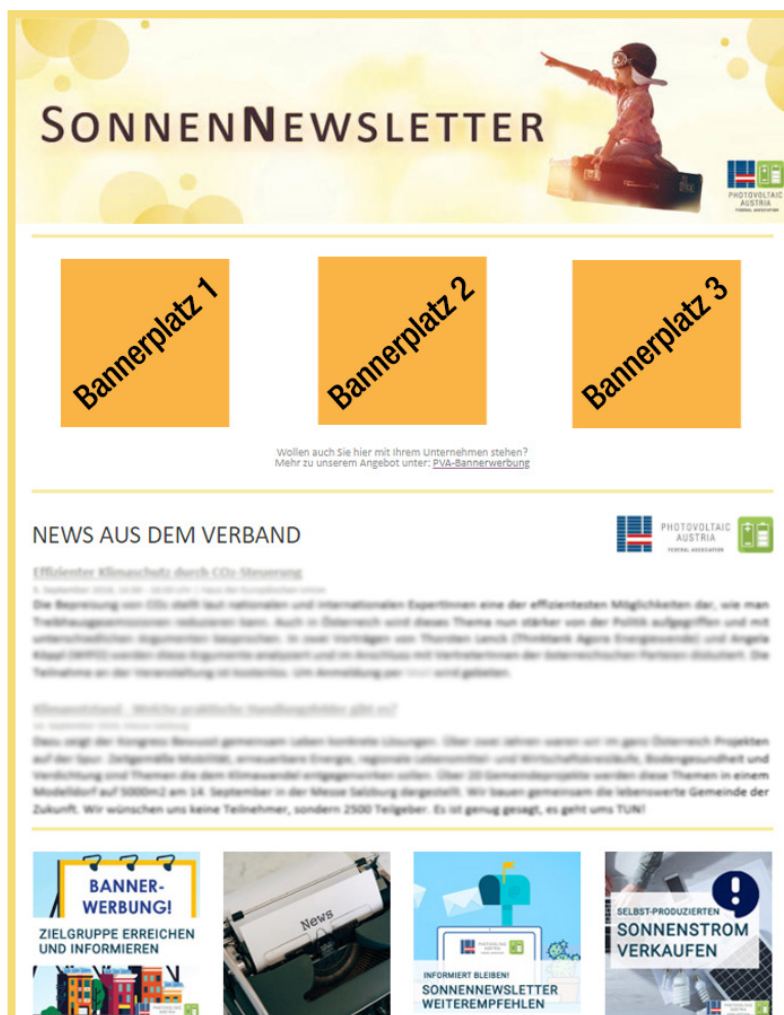
SonnenNewsletter mit Bannerplatz

Im SonnenNewsletter (Versand freitags, alle zwei Wochen) wird Ihnen jeweils zu Beginn des Newsletters eine Werbefläche zur Verfügung gestellt (siehe Bild unten). Sie können hier Ihren Werbeinhalt in Form eines Banners (Bildformat: siehe Seite 7) platzieren. Mit Klick auf Ihren Werbebanner gelangen Leser*innen direkt auf Ihre gewünschte Webpräsenz. Es stehen insgesamt drei Bannerplätze im SonnenNewsletter zur Verfügung (maximal ein Bannerplatz pro Unternehmen).